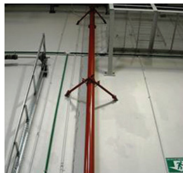
Colonne montante sprinkleur avec système de contreventement