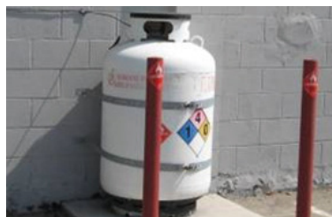
Réservoir de liquide inflammable fixé au mur par des sangles