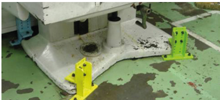
Outil de production ancré au sol