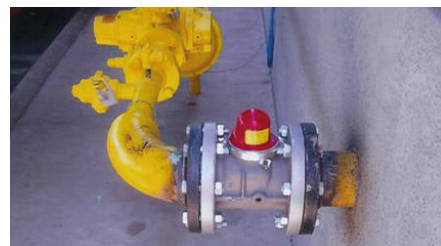
Vanne d'isolement antisismique sur une conduite de gaz naturel